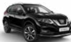
G41/M — Черный