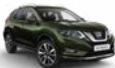
EAN/M — Оливковый