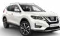
QM1/S — Белый