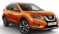
EVB/M — Оранжевый