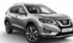
K23/M — Серебристый