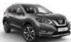
KAD/M — Серый