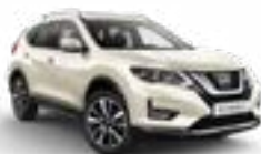
QAB/PM — Белый перламутр