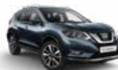
RAQ/M — Синий